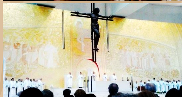
Basílica da Santíssima Trindade