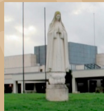
Homenagem na cidade de Fátima

Muitos visitantes que vão homenagear e buscar esperanças de vida em Nossa Senhora de Fátima se hospedam nesse local.