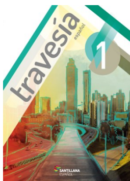
Travesía Español - 1º ano Editora Santillana.